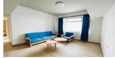
公共区域：厨房、餐厅、客厅、2-3个卫浴室