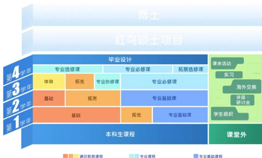
香港科技大學（廣州）本科課程結構

學校以本碩連讀及本博直讀（碩士為研究型碩士 M. Phil）為主要培養模式，對學生進行貫通式培養。與此同時，學校推出“因材施教”的課程模組超市，讓學生在教授的指導下進行個性化學習。同時，學生也將通過全英文、專案制的模式，培養以探索為主的主動學習方式。學生每學期可選擇不同學科背景的教授作為學術導師。導師言傳身教，為學生進行學術啟蒙，實現有溫度的教育。