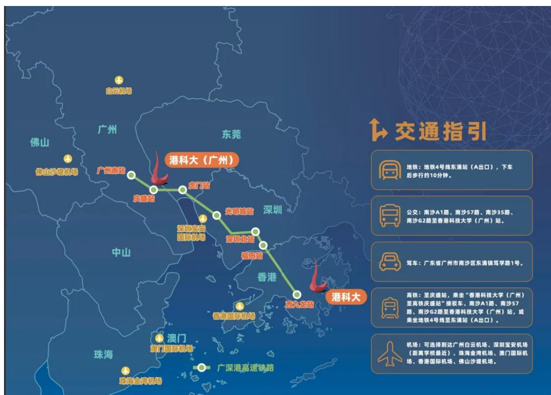
香港科技大學（廣州）校園區位

香港科技大學（廣州）位於廣州市南沙區慶盛樞紐，辦學位址為篤學路1號。學校佔地面積約1669畝，專案分兩期建設：其中專案一期用地面積約716畝，一期總建築面積約63.6萬平方米，於2022年9月正式投入使用。校園設計利用自然景觀與建築共融，並在設計及建設過程中融入節能、環保的關鍵性前沿技術，致力於將校園打造成為綠色、智慧、可持續發展的新標杆。