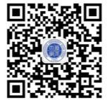
西北大学招生办公室