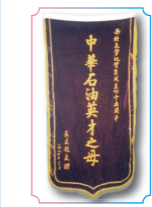
中华石油英才之母

在长期的发展历程中，西北大学形成了“发扬民族精神，融合世界思想，肩负建设西北之重任”的办学理念，汇聚了众多名师大家，产生了一批高水平学术成果，培养了大批才任天下的杰出人才，享有良好的学术声誉和社会声望，被誉为“中华石油英才之母”“经济学家的摇篮”“作家摇篮”。