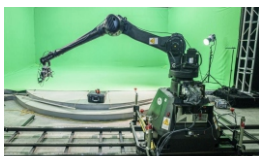
特种影像创作实验室