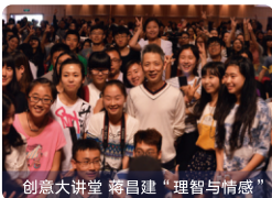
创意大讲堂 蒋昌建“理智与情感”