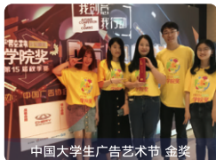
中国大学生广告艺术节 金奖

该专业是浙江省一流本科专业建设点，下设“广告策划”“数字营销”“影视广告”三个方向。本专业重视学生实践能力的培养，联合知名广告公司——华与华（上海）营销咨询有限公司，举办“超级符号实验班”，矢志于培养广告营销传播领域的领军人才，学生在各类专业竞赛中屡获佳绩。