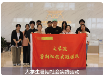
大学生暑期社会实践活动

该专业是学校重点专业，拥有茅盾研究中心、茅盾研究院、浙江网络文学院、创意写作中心、汉语与中国文化传播研究所、媒介哲学研究所等研究机构。该专业立足汉语言文学专业的深厚基础，培养拥有扎实语言文字功底、较强的创意思维和批判性思维、出色的中文表达能力、掌握传媒技能的“文学素养+创意能力+传媒技能”新时代应用型人才。