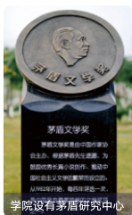
学院设有茅盾研究中心