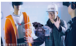
未来影像媒体交互实验室