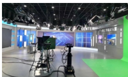
全媒体演播实验室