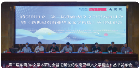
第二届华裔/华文学术研讨会暨《新世纪东南亚华文文学精选》丛书发布会