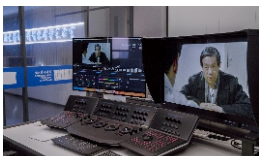
历史影音资料智能修护实验室