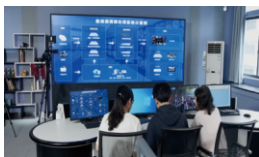
超高清视频技术实验室