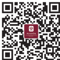
我院招办微信二维码